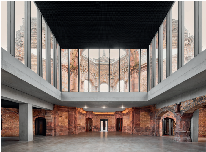
Ausbau der Trinitatiskirchruine zum Jugendzentrum Jugendkirche, Dresden von Code Unique Architekten, Dresden | Bauherrschaft: Ev.-Luth. Kirchenbezirk Dresden Mitte, Dresden