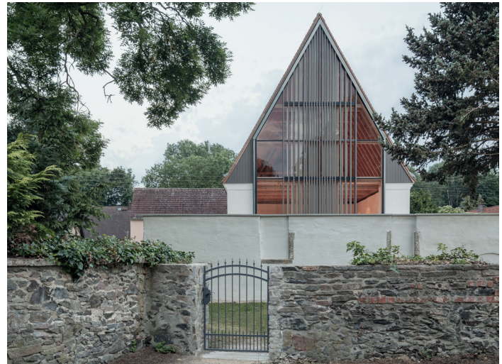
Neue Mitte – Kirche Canitz, Riesa OT Canitz von Peter Zirkel Gesellschaft von Architekten, Dresden | Bauherrschaft: Ev.-Luth. Kirchgemeinde Oschatzer Land, Oschatz