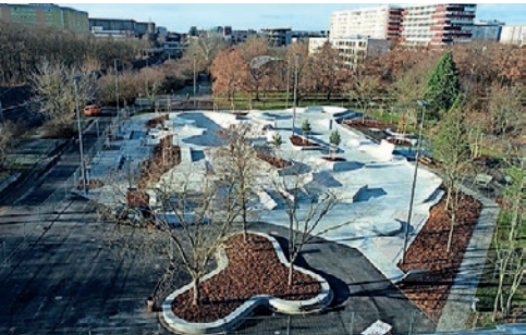
Skateanlage Parkallee Leipzig-Grünau