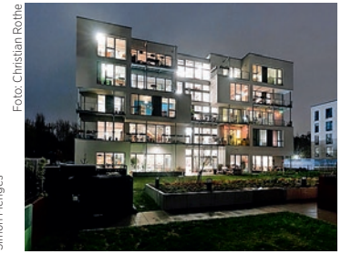
Ourhaus - Kooperatives Wohnprojekt im Leipziger Westen

Das Preisgericht wählte darüber hinaus vier weitere Wettbewerbsbeiträge für eine Anerkennung aus. Mit je 2.500 € wurden ausgezeichnet: