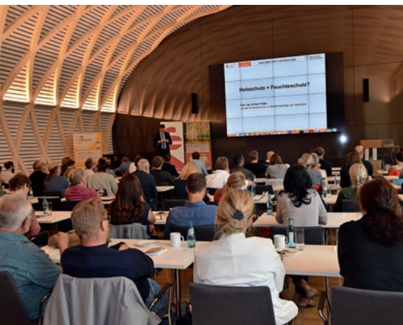
Vollbesuchter Saal im IHD Dresden

Der Holz.Bau.Treff Sachsen ging in die 2. Runde