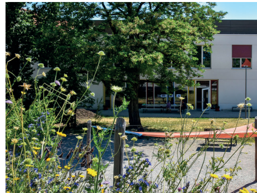
Planung: Barbara Kroll

ANMELDUNG: www.bdla.de/de/landesverbaende/sachsen oder www.aksachsen.org/akademie (ausschließlich online)