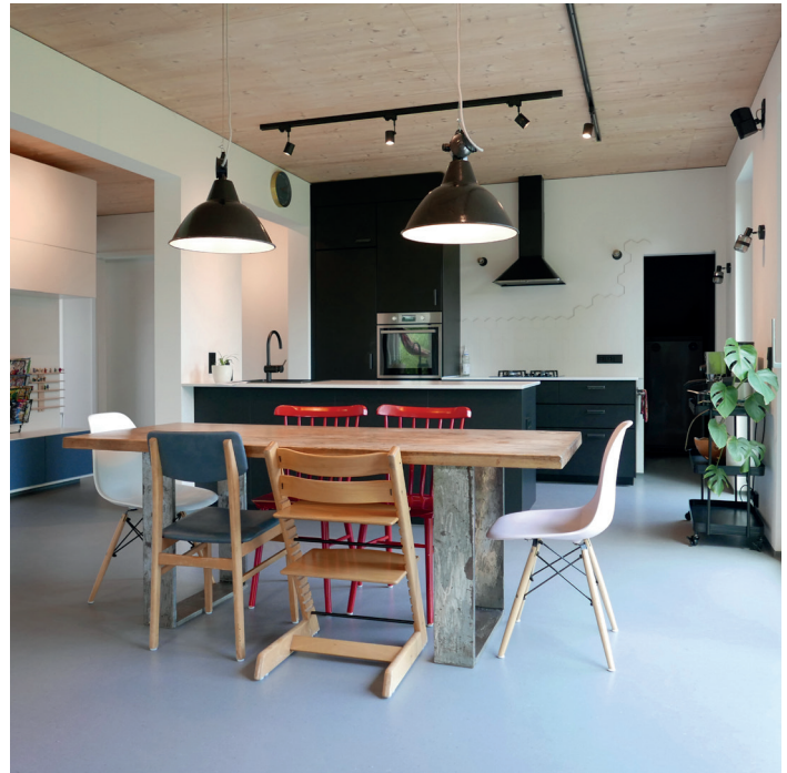
Fertigstellung: 2020 | Bauherr: Privat | Ausführung Holzbau: KUNZEHAUS